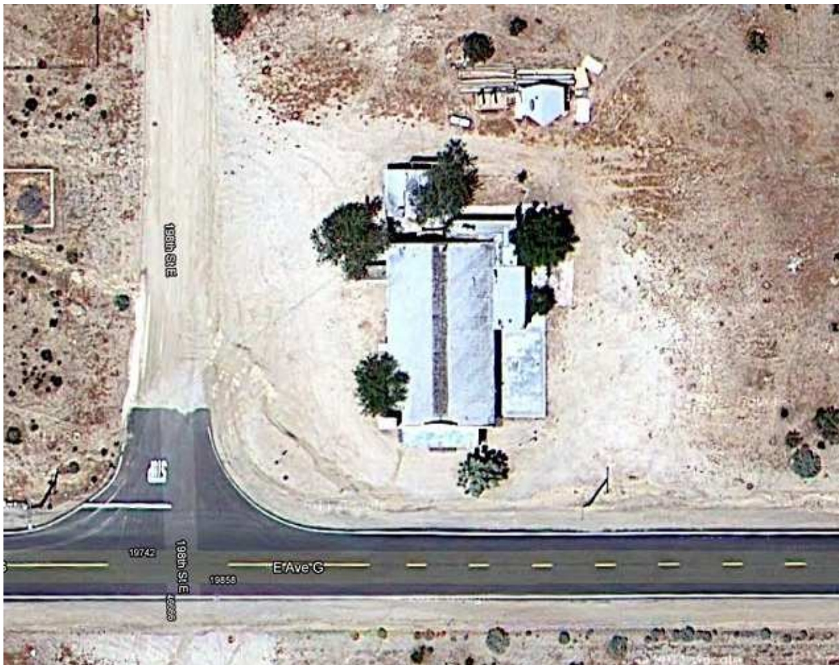
Kill Bill Church