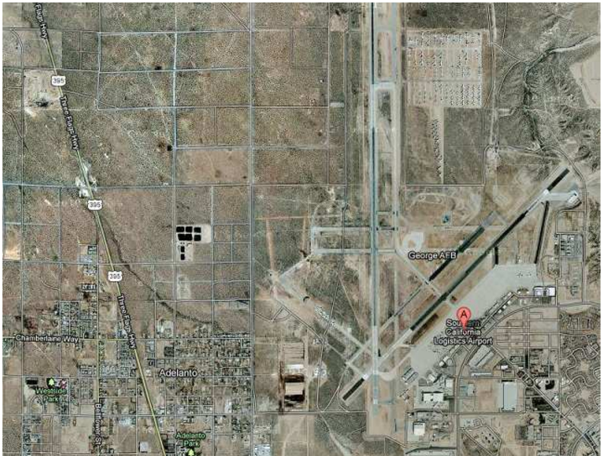
Southern California Logistics Airport