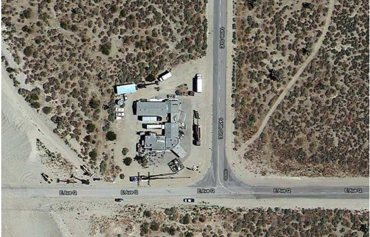
Four Aces Motel